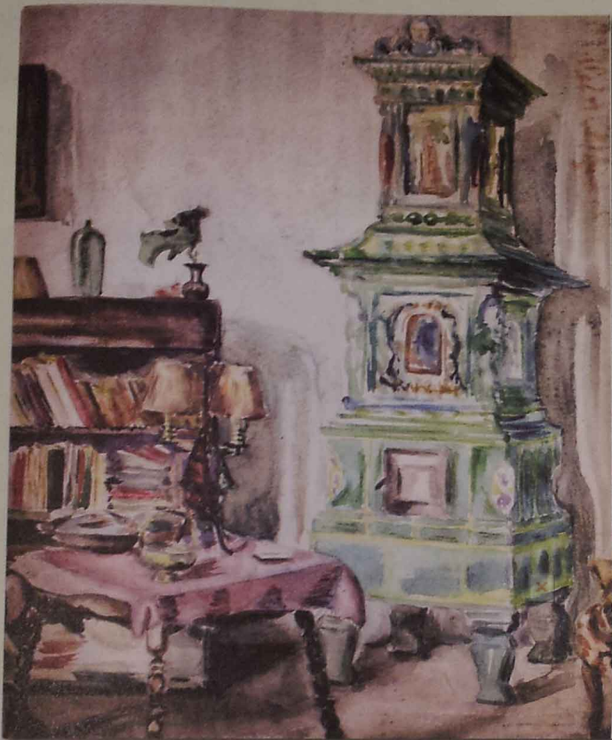
Interior acuarelă (din fondul Stoica)